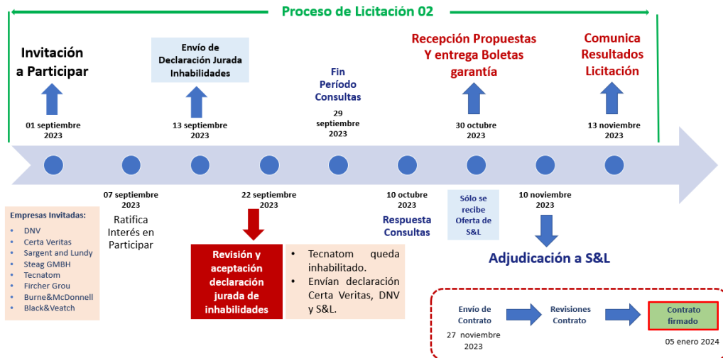
Figura 2.- Segundo proceso de Licitación